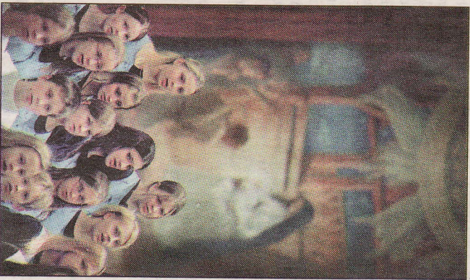
Kuoro onnistui tentävässään luoda joulumieltä.