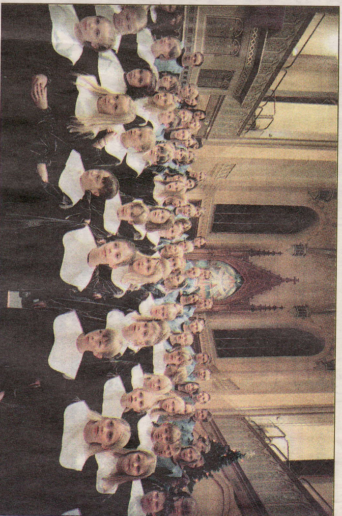
Vaasan musiikki luokkien kuorot eivät esitä jatkumolla perinteisiä joululauluja. Ohjelmistoon kuuluu muun muassa gregoriaanista, ortodoksisista ja keskiaikalaisista musiikkia.