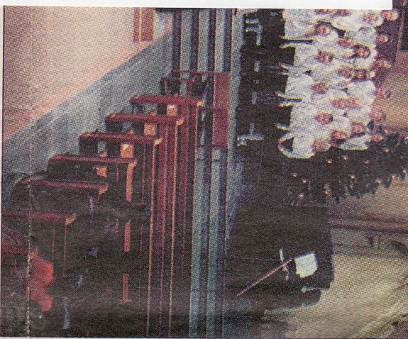
Yhdeksänteen luokkaan — äännet olivat